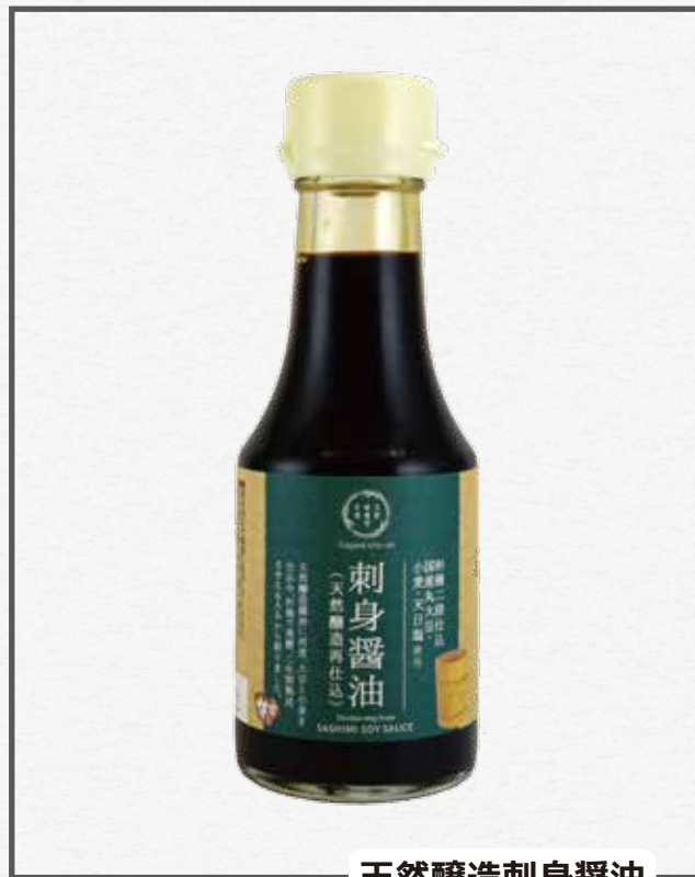
天然醸造刺身醤油